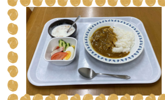
原田 (若林さんのカレーライス)

世話人さんの愛情たっぷりのお料理を一つには決められないとたくさんのメニューを仰って下さる利用者さんが多数でした。