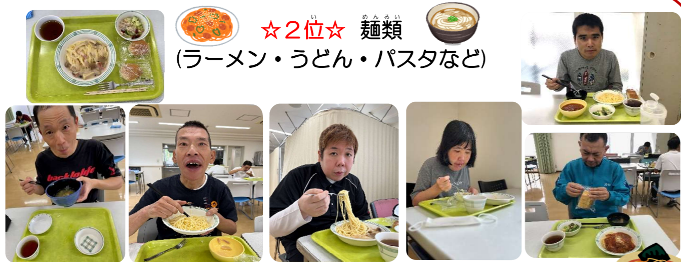
いろんな種類の麺類が第2位! スパゲッティはパンも一緒だからうれしいね!!