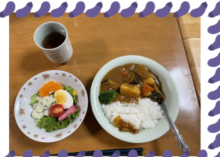
桜塚 (宇家さんのカレーライス)