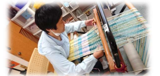
心を込めて織ってるよ!!