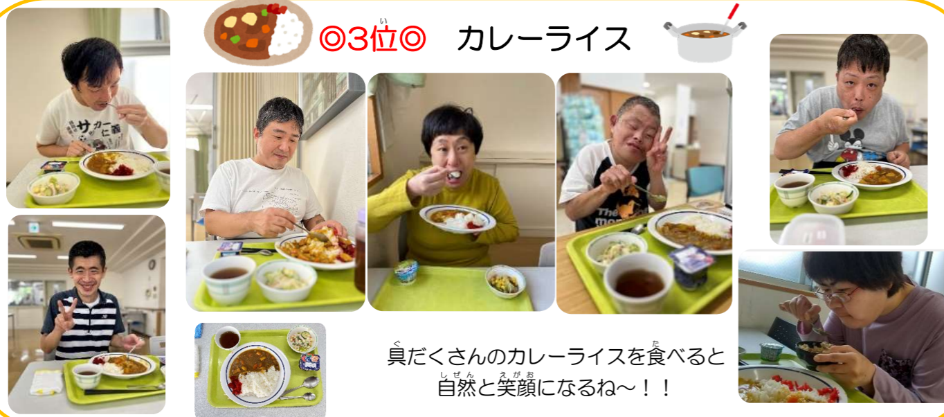
真だくさんのカレーライスを食べると自然と笑顔になるね~!!