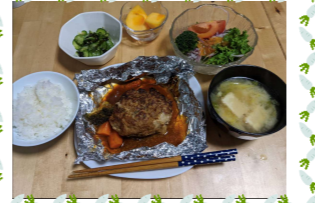
若竹 (神さんのハンバーグ)