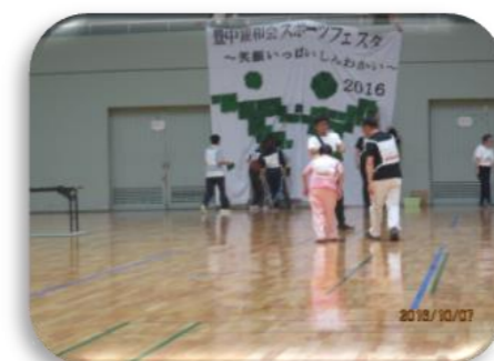
皆でシンボルマークを作りました。