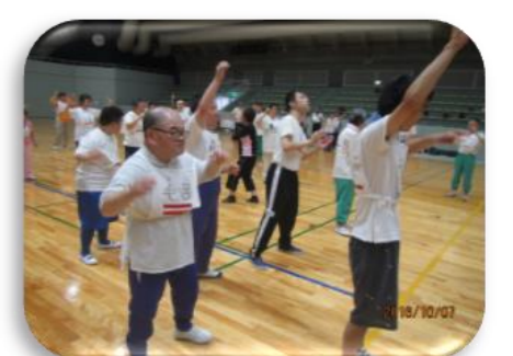
楽しく身体を動かしました♪